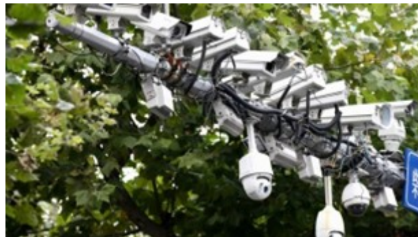
شکل ۲: نمایی از شبکه دوربینی سیستم اعتبار اجتماعی در چین

چین به نظارت شدید دولتی شهروندان با استفاده از روش‌هایی مانند دوربین مداربسته، سنسور اینترنتی و تجزیه و تحلیل کلان داده شهرت دارد [۷۸]. معروف‌ترین ابزار نظارتی در اختیار دولت، شبکه ۶۲۶ میلیون دوربین است که به دولت در تشخیص چهره به منظور شناسایی و ردیابی افراد کمک می‌کند [۷۹]. شکل ۲ نمایی از این شبکه دوربینی را نشان می‌دهد.