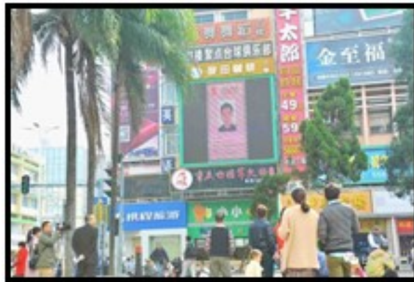
شکل ۱: نمایش تصویر متخلفان بر روی صفحه نمایش‌های شهری

همچنین افراد متخلفی که در لیست سیاه قرار گرفته‌اند اطلاعات و تصویرشان بر روی صفحات نمایش (LED) بزرگ در ایستگاه‌های قطار یا در نمای بیرونی ساختمان‌ها در معرض عموم به‌جهت شرم‌نده‌سازی قرار می‌گیرد که شکل ۱ نمایانگر این موضوع است.